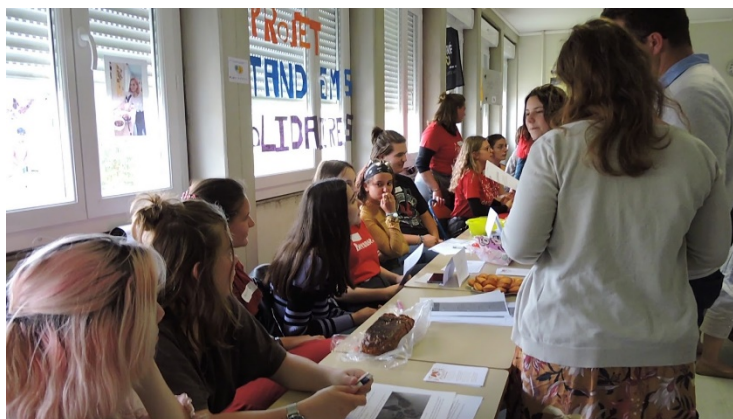
Les lycéens d'Avallon présentent leur Tandem Solidaire

Un temps de valorisation régional a été organisé dans le cadre des Rencontres de l'éducation à la citoyenneté mondiale en Bourgogne-Franche-Comté , organisées le jeudi 13 juin 2019 au Lycée du Parc des Chaumes à Avallon (cf. programme en ligne sur le site de BFC International). Cette rencontre a réuni 92 participants de toute la région et a permis une belle visibilité pour les 22 projets de Tandems Solidaires représentés.