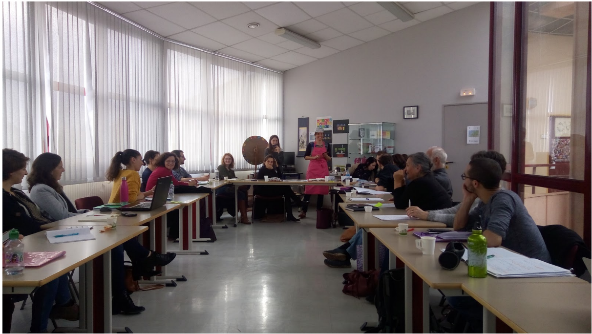
Découverte et expérimentation de l'outil "Burger Quiz des Objectifs de Développement Durable"

Satisfaction des participants au sujet de la formation :