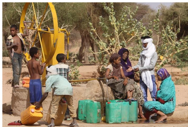
Les Puits du Désert